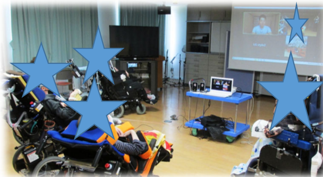
いろいろなオンラインイベント

この日は参加者のリクエストによりコーヒーの写真撮影会。人工呼吸器を装着して会場での参加、病室からオンライン参加される方もいます♪